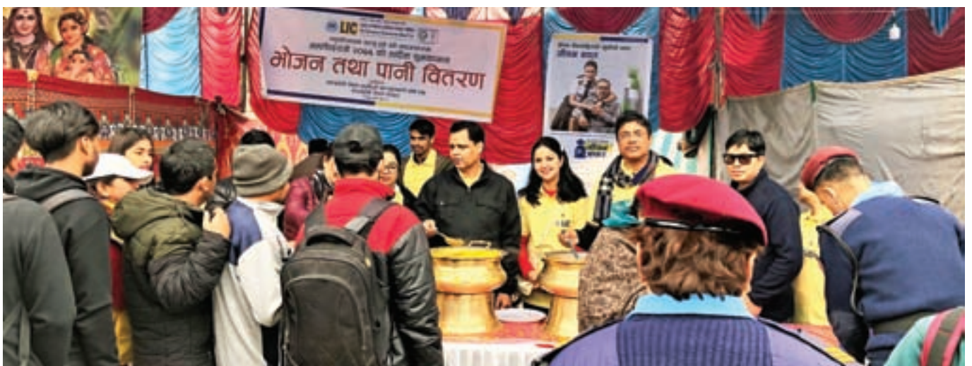
Food and Water Distribution at Pashupatinath during Mahashivratri