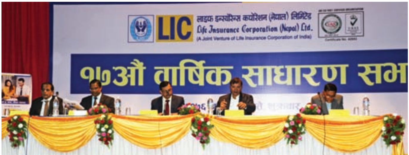
Board of Directors participating at 17th AGM in Kathmandu