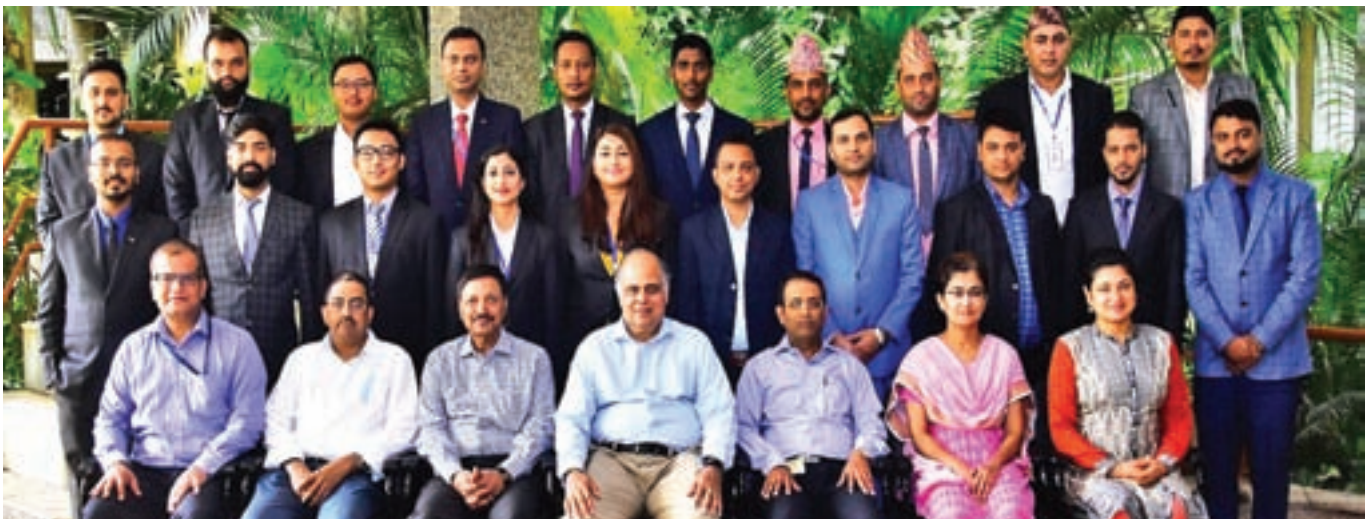
20 staffs taking pic with trainers in III, Pune, India after getting 7 days special course of life insurance.