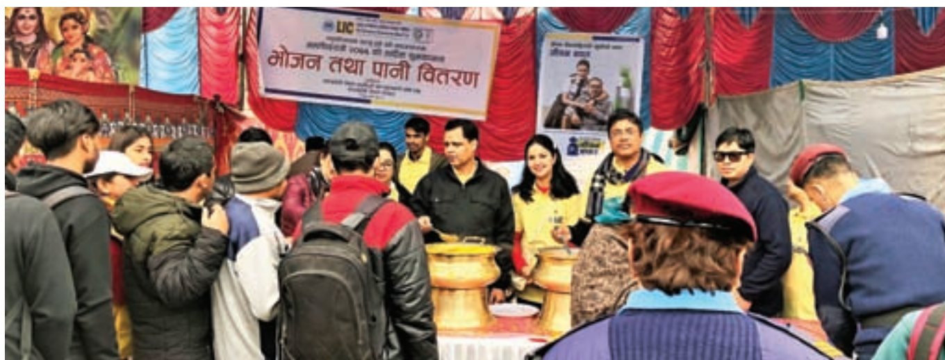
Food and Water Distribution at Pashupatinath during Mahashivratri