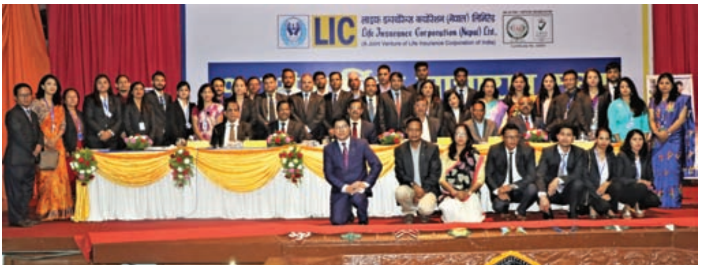
Corporate Staffs with Directors at 17th AGM in Kathmandu