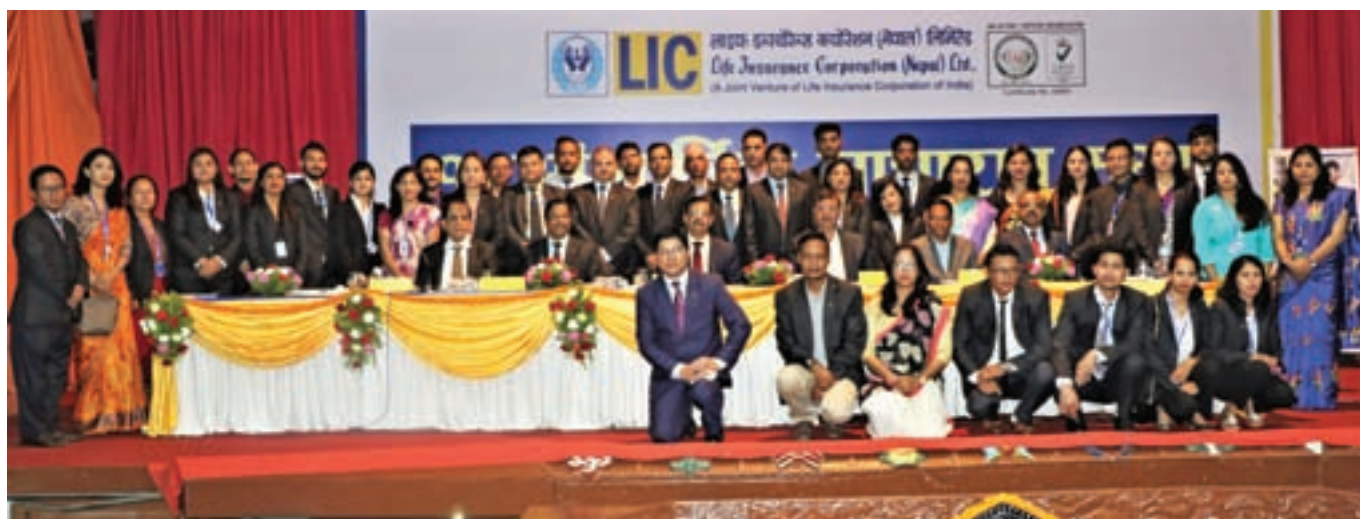
Corporate Staffs with Directors at 17th AGM in Kathmandu